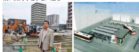
工事が進む栄町バスターミナル現場