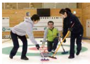
何事にも挑戦! 自らカーリングを楽しむ