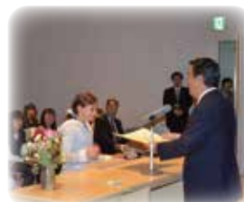
東区児童絵画展実行委員長として表彰式で