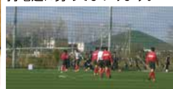
健康都市を目指し、スポーツ施設の整備を充実

最近の調査で、札幌の子どもの体力は全国でも最低レベルであるということがわかりました。野球やサッカーをはじめ、いつでもどこでも誰でも始められるラジオ体操やパークゴルフ、美香保体育館でできるカーリングなどを通じ、子どもたちの体力向上や中高年の健康維持増進に努めてまいります。