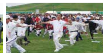
札幌地方ラジオ体操連盟会長を務め昨年、全国大会をモエレ公園で開催