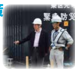
元町コンパクトトイレ設置現場を視察