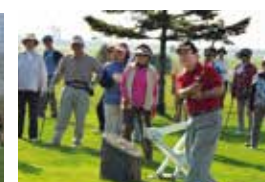
ナイスショット! 地域の皆さんとパークゴルフ大会